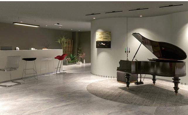
音乐餐厅空间设计 作者：王雪 指导教师：房静