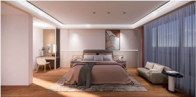
客厅空间设计 作者：刘香艺 指导教师：吕淑聪