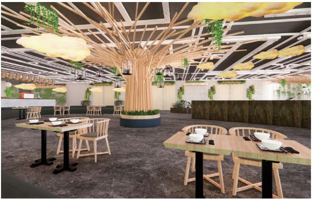
餐厅空间设计 作者：赵淑甜 指导教师：吕淑聪