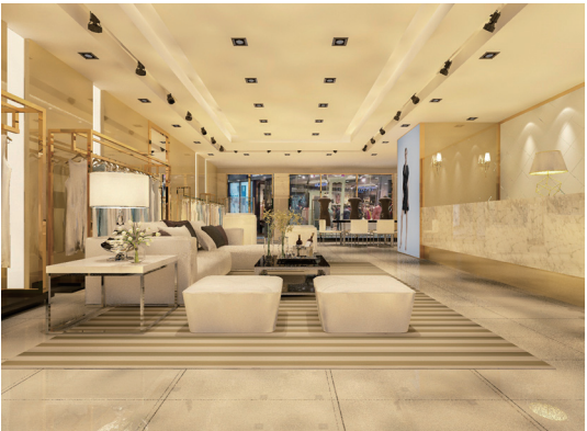
服装店空间设计 作者：陈岚 指导教师：房静