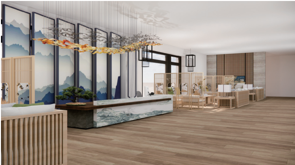
水艺阁 作者：刘一霏 指导教师：肖煜梓