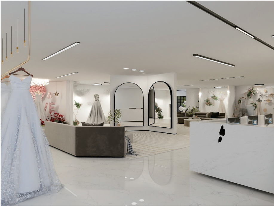
婚纱店空间设计 作者：何昌慧 指导教师：房静