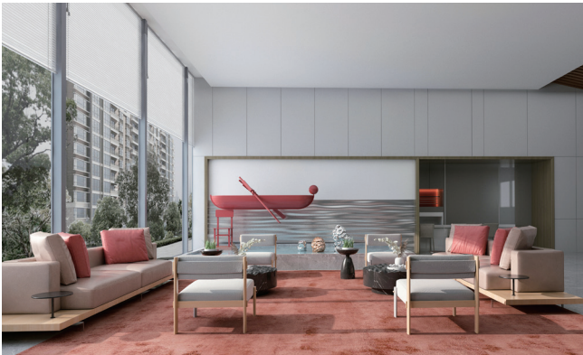
公共空间设计 作者：赵聪颖 指导教师：房静