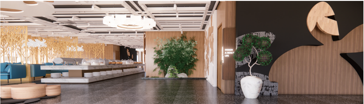
餐厅空间设计 作者：赵淑甜 指导教师：吕淑聪