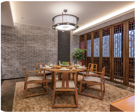
餐厅空间设计 作者：郭子妍 指导教师：吕淑聪