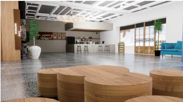
餐厅休闲区空间设计 作者：赵晴 指导教师：吕淑聪