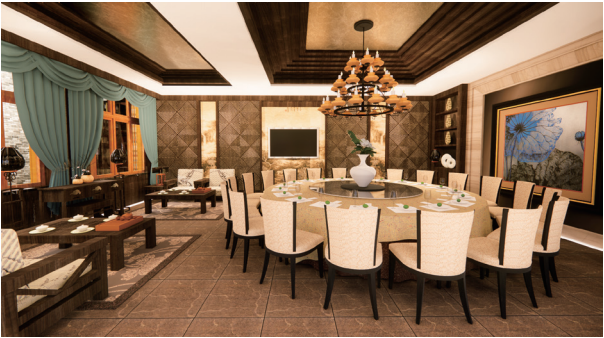
胡同里 作者：林美意 指导教师：肖煜梓