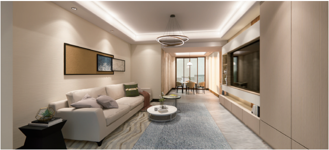
客厅空间设计 作者：刘香艺 指导教师：吕淑聪