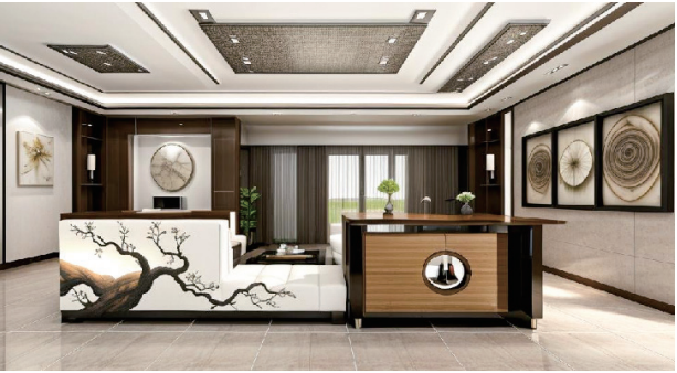
膳福斋 作者：李程洋 指导教师：肖煜梓