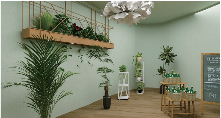
绿植店空间设计 作者：路佳琪 指导教师：房静